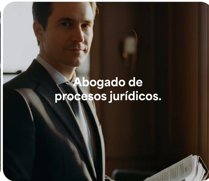
Abogado de procesos jurídicos.