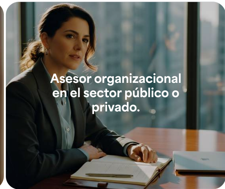
Asesor organizacional en el sector público o privado.