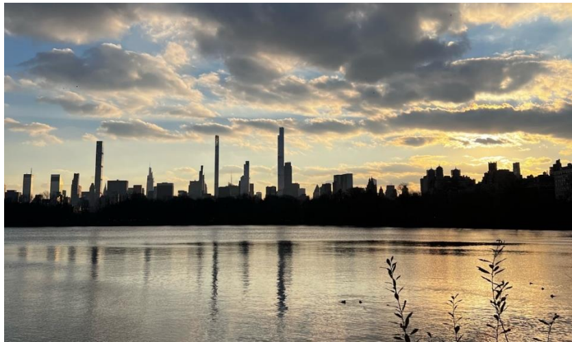
Atardecer en Nueva York desde el Central Park con vista al Billionaires' row.

del agua potable a la ciudad en 1842. Esta fuente quizás sea más recordada por la película Mi Pobre Angelito 2.