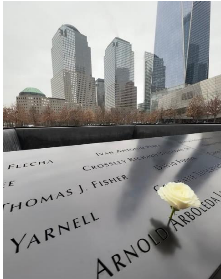
9/11 Memorial.