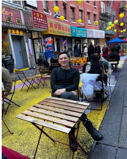
Doyers St.

abandonada en la década de los 50 y de los 60 del siglo pasado y sólo hasta el año 2014 se abre al público como un parque elevado de un poco más de 2 kilómetros de longitud lleno de jardines convirtiéndose en un sistema vivo y un importante atractivo turístico.